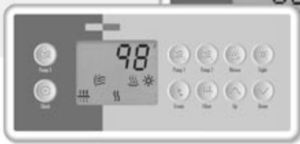
Système à triple pompe et turbine (TSC-4-10K)